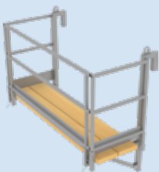
Art. Nr. 34405 elea Betonierbühne 2000 für Hohlwände